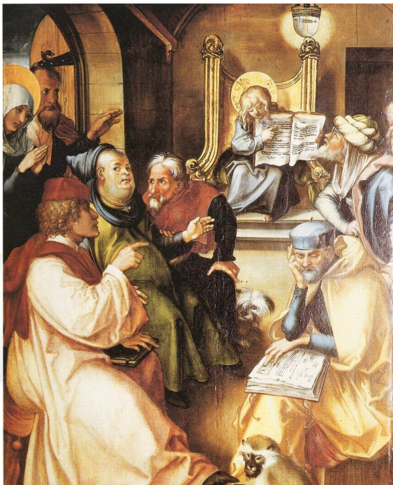
Jésus enseigne à douze ans d'Albrecht Dürer

Saint Anselme de Cantorbéry, que nous avons fêté mardi dernier, écrit ceci : « J'ose dire hardiment de la très sainte Vierge ce que saint Jean a dit du Verbe éternel ; c'est que comme rien n'a été fait sans celui-ci, rien n'a été refait sans celle-là. Le grand Dieu donne davantage au Fiat de la Vierge qu'au sien. Pourquoi cela ? Parce que le Fiat de Dieu est un Fiat de commandement, et le Fiat de la sacrée Vierge est un fiat d'obéissance. » 1