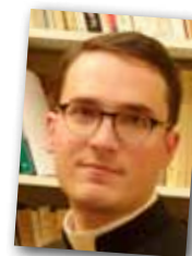
Abbé Jean de Loÿe

Le souhait de clarification doctrinale anime la Fraternité depuis ses origines et a motivé il y a une dizaine d'années des discussions à Rome. La question est maintenant de savoir si le Vatican pourra véritablement restreindre les critères de catholicité à une adhésion totale aux réformes de Vatican II. A l'heure où des points de doctrine aussi élémentaires que l'indissolubilité du mariage ou la malice des actes contre-nature font l'objet de contestations profondes au sein de l'Église au point d'accélérer la désagrégation de son unité, une telle exigence n'a aucun sens et pourrait bien ressembler à un chant du cygne.